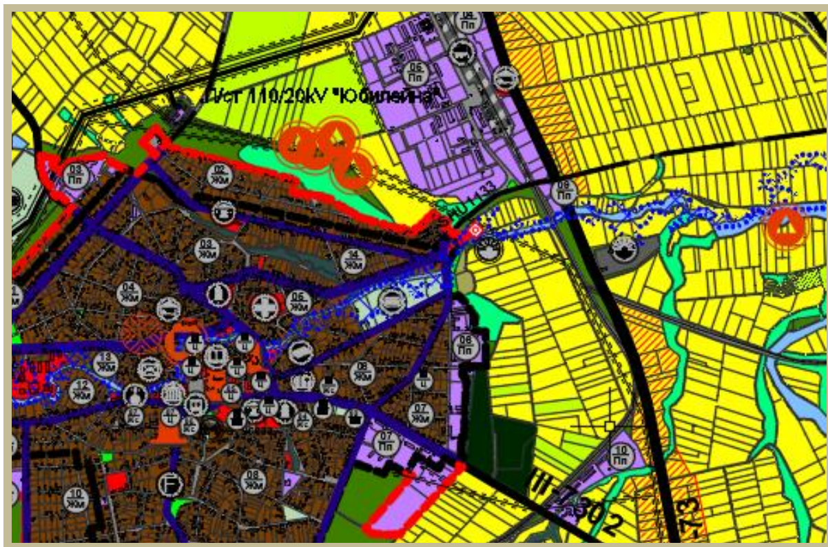
Фрагмент от ОУП Смядово , с предвидена ПСОВ- източно от града , в сив цвят