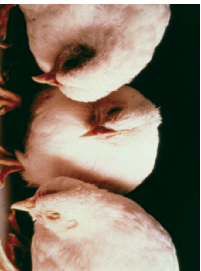
Птичета, заболели от птичи грип с оток на главите.

Заболялите от инфлуенца птици са с разрошени пера, омърнушени, липсва апетит, установява се намаляно яйценосене, посиняване и оток на гребена и менгушите или цялостен оток на главата. Проявяват тежки увреждания на дихателната система — кихане, кашлица, хрипове, изгечения от очите, диария, нервни признаци, парализа и смърт.