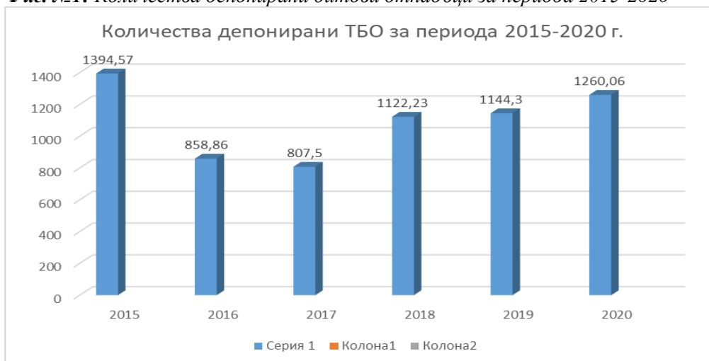
Фиг. №1: Количества депонирани битови отпадъци за периода 2015-2020

Данните показват, че при сепариране през 2016г. процентът на отделените отпадъци е 35,49%, но към 2020г. процентът на сепарираните отпадъци намалява до 8,49% поради, което е необходимо да се търсят други възможности за сепариране или пълно оползотворяване на смесените битови отпадъците с цел намаляване на разходите за депониране и отчисления.